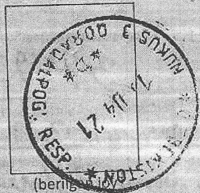
(berilgan 6 oy taqvim shtempli izi)

O'zbekiston Respublikasining «Pochta aloqasi to'g'risida»gi Qonuniga muvofiq pochta aloqasi obyektlari berilgan kundan boshlab 6 oy davomida qabul qilingan pochta jo'natmalari uchun javob beradilar